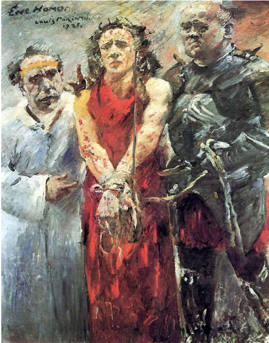
Lovis Corinth – Ecce Homo – 1925