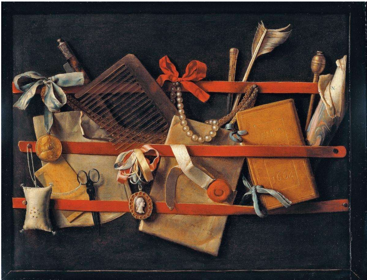
Samuel Dirksz van Hoogstraten – Nature morte – 1664