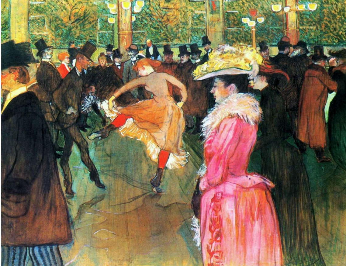
La Danse au Moulin-Rouge d'Henri de Toulouse Lautrec