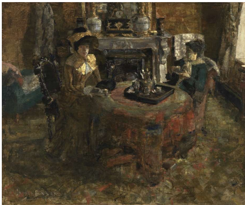
James Ensor – Namiddag in Oostende

Choisissez quelques toiles présentant l'une des caractéristiques de flou listées plus haut. Regardez et pensez à partager vos émotions avec art-toi en m'envoyant un email à catherine.hahn@art-toi.com . Si vous êtes d'accord, je publierai vos impressions.