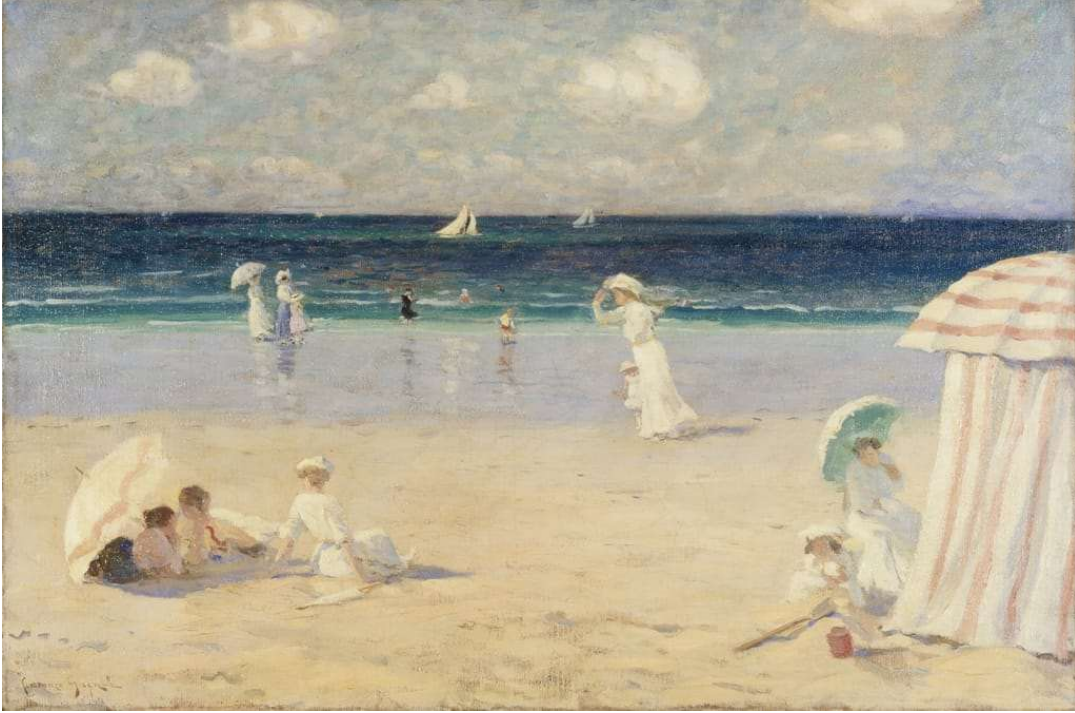
Clarence Gagnon – Brise d'été à Dinard – 1907