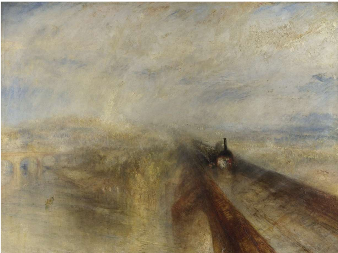
William Turner – Pluie, vapeur et vitesse - 1844