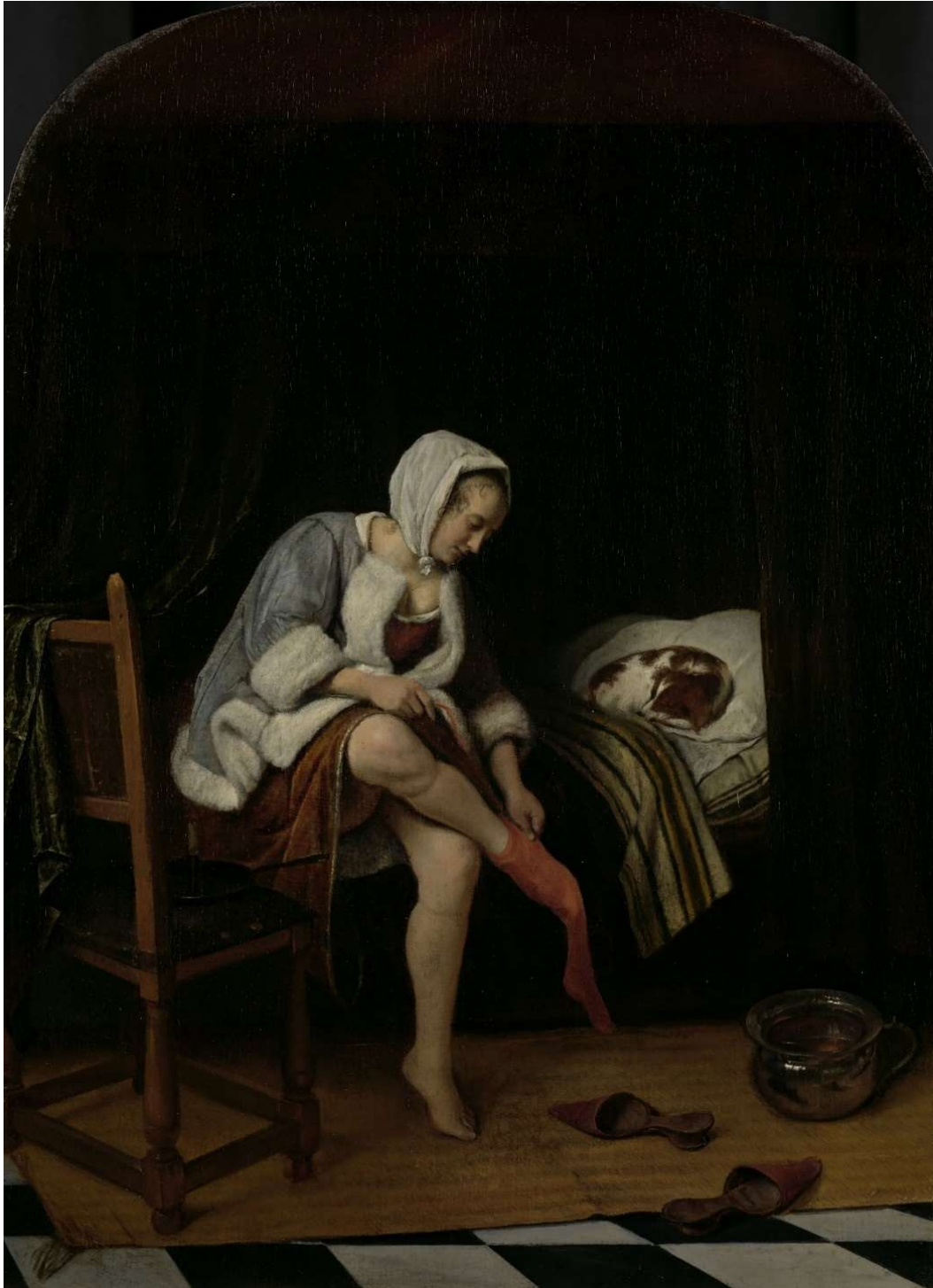
Jan Havicksz Steen – Femme à sa toilette – 1655