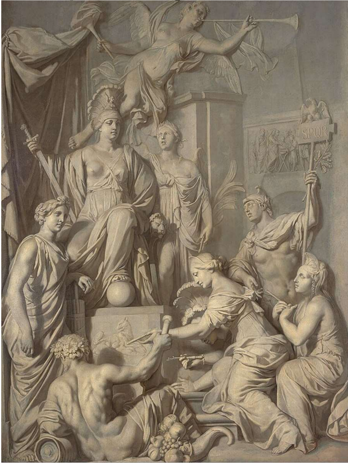
Gerard de Lairesse – Allégorie de la Gloire