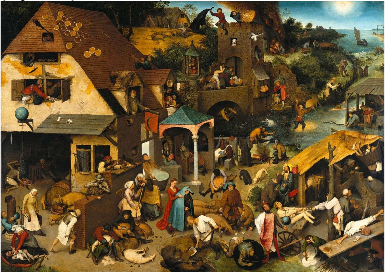
Pieter Brueghel l'Ancien - Les Proverbes flamands, appelé aussi Le Monde renversé - 1567

Ça grouille, ça fourmille de proverbes dans les détails !