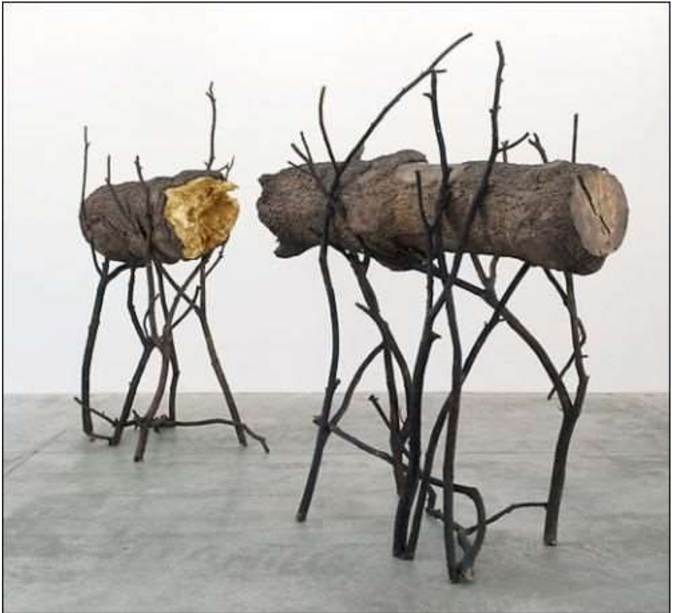
Giuseppe Penone – TrA... - 2008

L'une des caractéristiques de l'art du XX e siècle est la facilité avec laquelle il semble possible de copier les œuvres. Un carré blanc sur un fond blanc, un monochrome ou pire, un porte-bouteille ! Je vous propose de vous accompagner sur le chemin de la démystification de l'art contemporain pour mieux l'apprécier