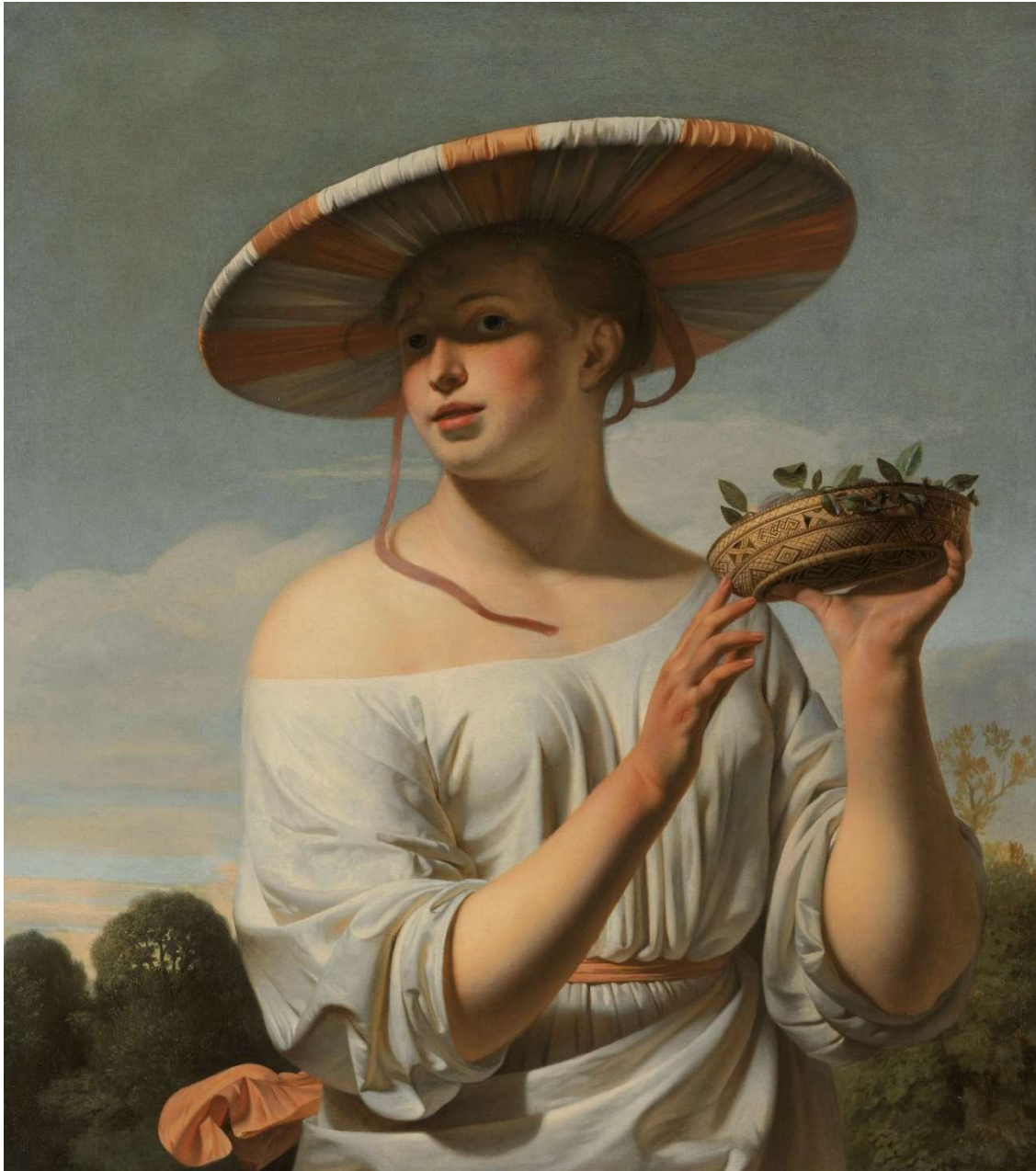
Cesar van Everdingen – Girl with hat – 1645-1650

En regardant cette œuvre, beaucoup d'entre nous pensent à une scène se déroulant dans le Sud, en Toscane peut-être plus particulièrement. Comment le peintre s'y est-il pris pour nous suggérer ce coin du monde ?